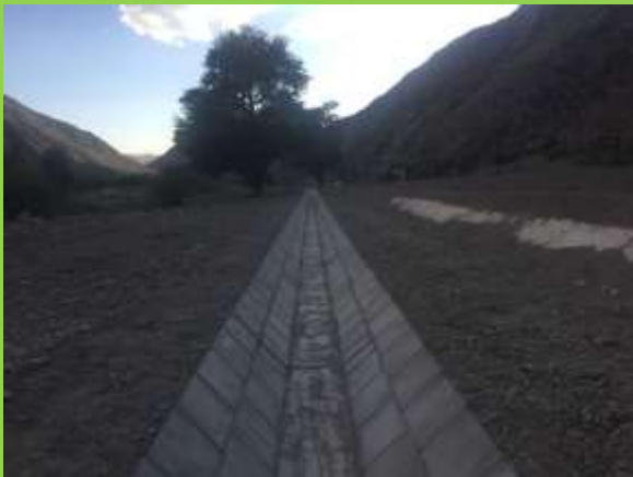
混凝土预制板排水沟