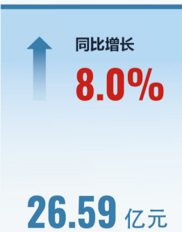
完成公路建设投资